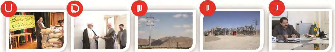
تقدیم بیش از ۵۰۰ تنه شربید در صنعت آب و برق کشور به جمهوری اسلامی ایران