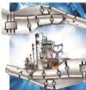
کمیته پدافند غیر عامل و بحران شرکت

افزایش ضریب اطمینان تامین برق استان در شرایط مختلف اقدامات مؤثری در اجرای پروژه‌ها، تامین تجهیزات و امکانات و تهیه طرح‌های پدافند غیرعامل اقدام نموده است.