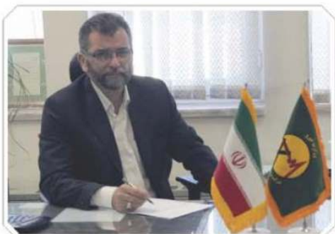
منطقه‌ای یزد، پس از طی موفقیت‌آمیز مراحل آزمایشی، بهره‌برداری قرار گرفته است.

یزد به آدرس www.yrec.co.ir و ثبت مشخصات لازم در این سامانه، درخواست خود را در راستای پاسخگویی به استعلام حریم و برای بررسی حریم ملک مورد نظر ثبت نموده و یادریافت شماره پیگیری از این سامانه، روند پاسخ به درخواست خود را به‌طور غیرحضور پیگیری نمایند. گفتنی است سامانه استعلام حریم شبکه انتقال و فوق توزیع شرکت برق