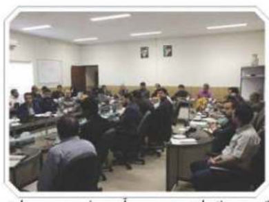
قدرت و تأثیرات مغرب آن‌ها بر تجهیزات

الکتریکی، مشارکت مصرف‌کنندگان برای کاهش هارمونیک، از اهمیت ویژه‌ای برخوردار است. کارگاه آموزشی «کیفیت توان در شبکه‌های برق» با هدف آشنایی مشترکان با پارامترهای تأثیرگذار کیفیت توان و