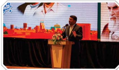
ادامه در صفحه ۲

مشاور وزیر در مراسم تجلیل از اینارگران صنعت آب و برق استان یزد گفت: