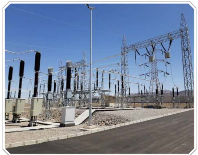
پست ۴۰۰ به ۱۳۲ کیلوولت بهادران در اسفندماه ۱۴۰۱ برق‌دار شد. به گزارش روابط عمومی شرکت برق منطقه‌ای یزد، پست ۴۰۰ به ۱۳۲

دو بی ورودی ۴۰۰ کیلوولت، یک دستگاه ترانسفورماتور ۴۰۰ به ۱۳۲ به ۳۳ کیلوولت با ظرفیت ۲۰۰ مگاوات آمپر، یک فیدر اینکامینگ و دو فیدر ۳۳ کیلوولت خروجی در سمت ۳۳ کیلوولت از مشخصات این پروژه است که از سمت ۴۰۰ کیلوولت با پست‌های مهرگان و نخلستان در ارتباط است و از سمت ۳۳ کیلوولت نیز به شرکت پیشگامان و سرب و روی مهدی‌آباد متصل شده است.