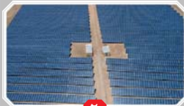
۲ دوازدهمین نیروگاه خورشیدی بزرگ استان یزد به بهره برداری رسید