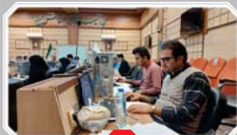
۵ تقدیر استاندار یزد از دست‌اندرکاران سفر استانی رئیس جمهور در برق منطقه‌ای یزد