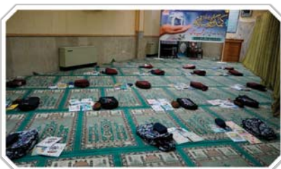
پایگاه مقاومت بسیج اداری شهید سامعی این شرکت برگزار شد.

به گزارش روابط عمومی شرکت برق منطقه‌ای یزد، در این مرحله از رزمایش مواسات و همدلی حدود ۴۰ بسته لوازم التحریر شامل کوله پشتی، دفتر و دیگر لوازم نوشتاری به ارزش بالغ بر ۱۲۰ میلیون ریال گردآوری شده است تا در میان خانواده‌های کمتر برخوردار شناسایی شده، توزیع گردد. گفتنی است اعتبار صرف شده برای تدارک بسته‌های مذکور توسط کارکنان شرکت برق منطقه‌ای یزد تامین شده است.