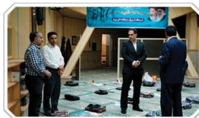
رزمایش مواسات و همدلی شرکت برق منطقه‌ای یزد هم‌زمان با آغاز سال تحصیلی جدید به همت

در راستای ترویج فرهنگ کتاب‌خوانی و با رویکرد مدیریت مصرف انرژی برگزار شد: